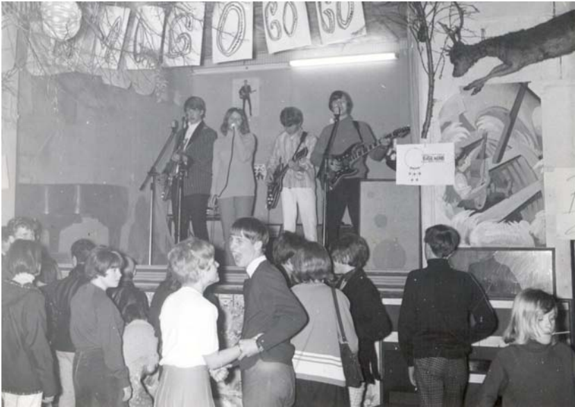
Birds of Prey underholder