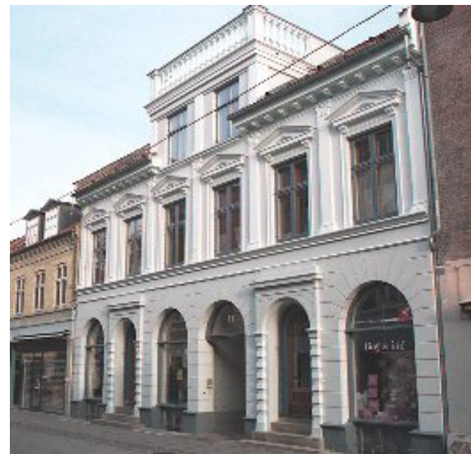
Nørregade 12, Køge

Køge Byhistoriske Arkiv drives af Køge Fonden med tilskud fra offentlige og private midler. Køge Byhistoriske Arkiv har til formål at indsamle, registrere og videreformidle privat historisk materiale om Køge, dens borgere, foreninger, virksomheder og institutioner.