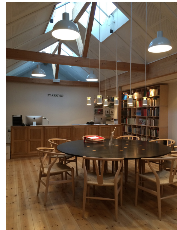
Køge Byhistoriske Arkiv, Nørregade, Køge

Støtteforening til Køge Byhistoriske Arkiv og bygningsbevaring i Køge