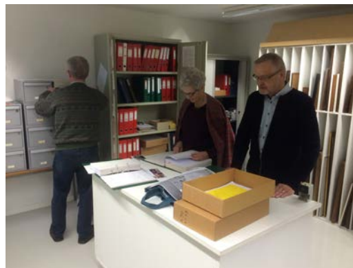
Her ses nogle af de frivillige medarbejdere ved Lokalhistorisk Arkiv for Herfølge-Sædder Sogne i færd med arbejdet