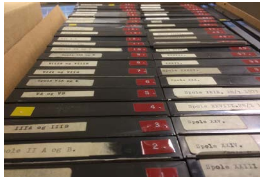
Kassetebånd fra arkivets samlinger blev digitaliseret og således reddet for eftertiden med generøs støtte fra Lokalhistorisk Forening