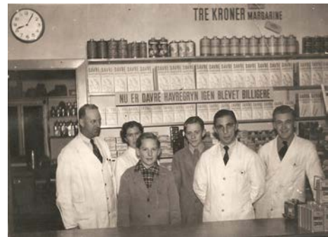
Borup Brugsforening, 1952