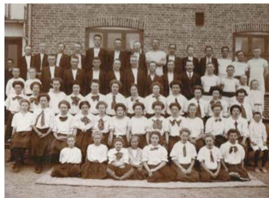
Gymnaster fra Skensved Gymnastikforening 1910-1911. (B 7358).