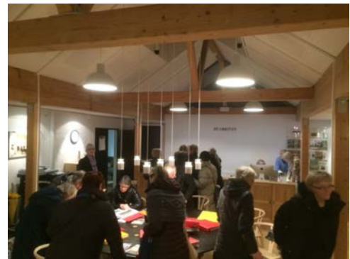
Byarkivet deltog ikke i Kyndelmisse i Køge 2015 pga. flytningen til Nørregade 4. I 2016 var Køge Byhistoriske Arkiv og Køge Museum igen tilbage i Kyndelmisse. Over 1300 mennesker besøgte huset i løbet af aftenen.

Alle arkiver i Køge Kommune benytter registreringsprogrammet Arkibas. Det er udviklet af de danske lokalarkiver gennem mange år. Senest har A.P. Møller Fonden bidraget til udviklingen af Arkibas. Ved hjælp af