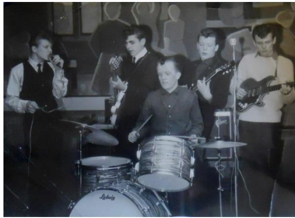
En øveaften i DUI-Huset, 1964