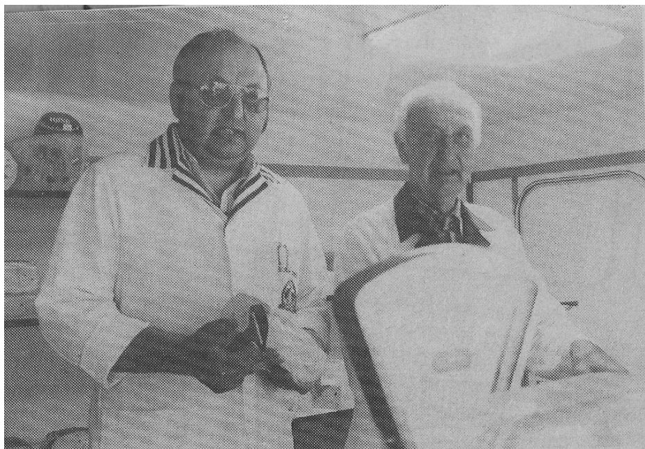
Min far og jeg på Køge Torv den sidste dag, inden jeg overtog vognen.

Sideløbende med osteturene havde min far fra 1939 stadeplads med salg af oste på Køge Torv om lørdagen.