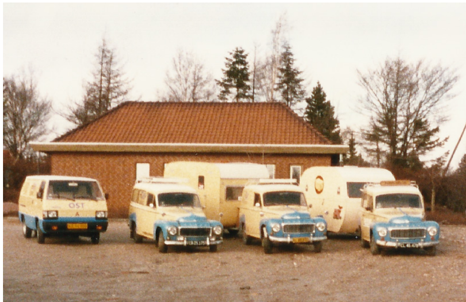
Vognparken oprangeret – klar til dagens arbejde

Vi har slidt adskillige biler op under salgsturene. Tre Volvo'er, to Mitsubishi'er og den sidste var en Toyota Hiace.