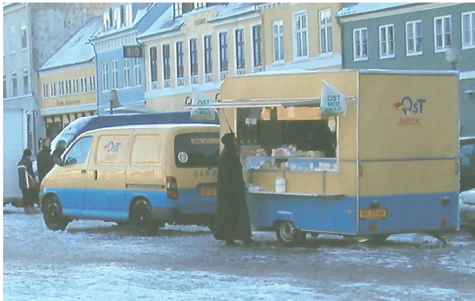
Der åbnes for ostesalget på torvet på en regnfuld dag.

Det kom til at hedde Køge Torvelaug. Jeg var formand i 10 år.