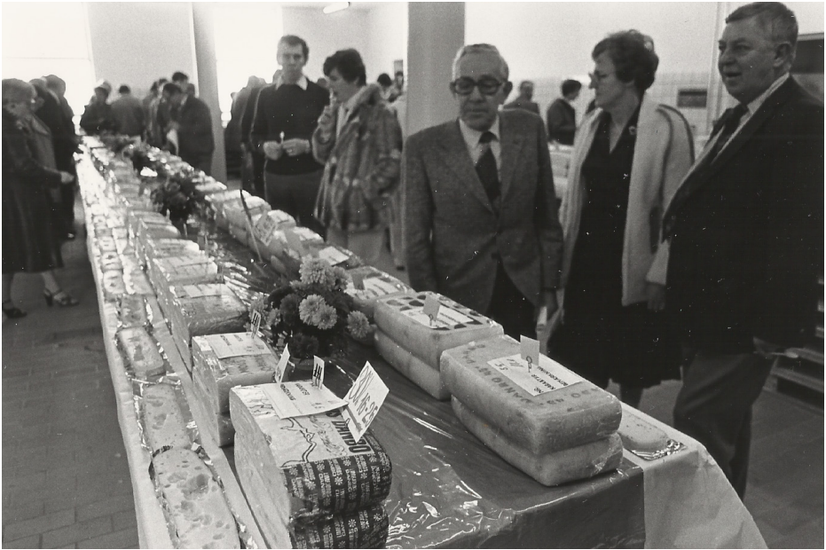
Ostene beskues før en bedømmelse

Vi købte Ølstedbro Gl. Mejeri ved Horsens, et nedlagt mejeri. Ostehandlerforeningen eksisterer stadig, men ligger nu i Odense under samme tag som slagter-, fiske- og ostehandlere, og Ølstedbro Gl. Mejeri blev solgt og huser nu, efter forskellige andre aktiviteter, Ølsted Bryglaug. Sjællandskredsens havde en årlig ostebedømmelse i Ringsted, senere Slagelse.