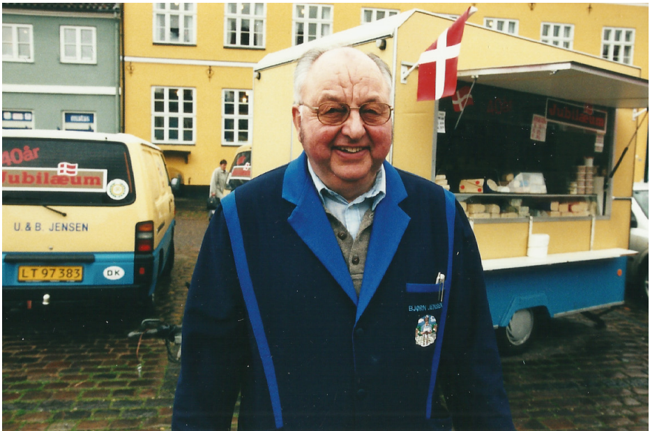
Her er jeg ved ostevognen i anledning af jubilæet

Vi var også på tur til Holland med Ostehandlerforeningen, hvor vi besøgte mejerier og smagte på oste.