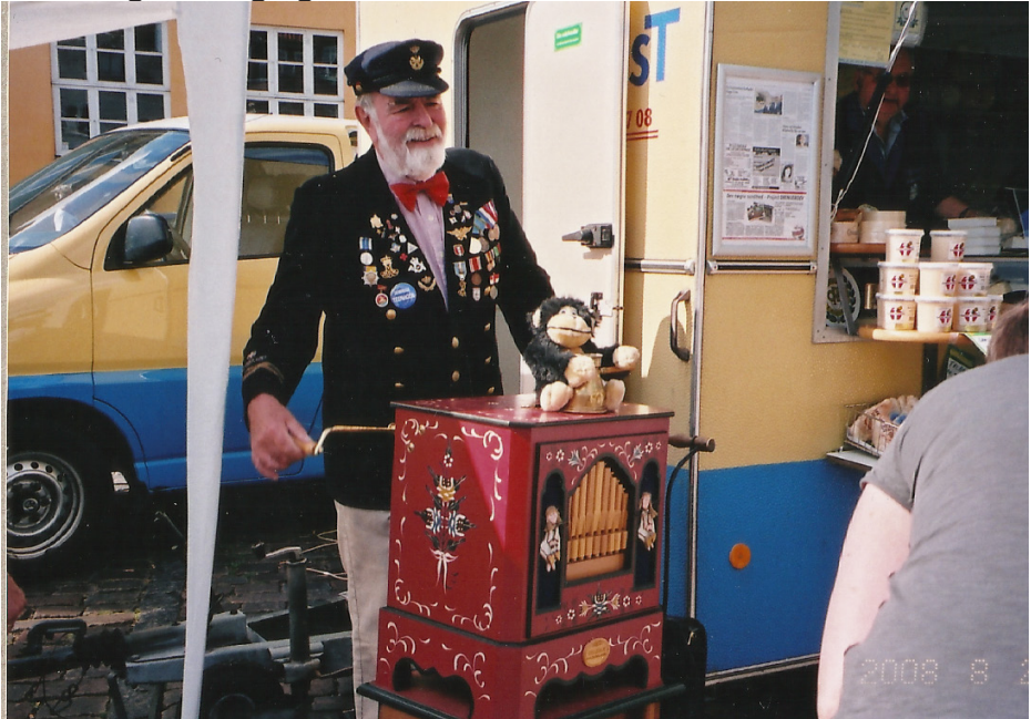
Lirekassemanden giver et nummer ved vognen.

Jeg kender dem jo næsten alle sammen, og efterhånden er deres børn og børnebørn kommet til, og den gode snak om oste, den findes stadig. Folk kan stadig godt lide, at der er god tid at handle i, og vind og vejr skal da også stadig lige vendes.