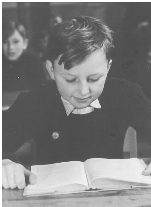
Her er jeg 11 år, og meget optaget af en læsebog på Brockmanns skole.