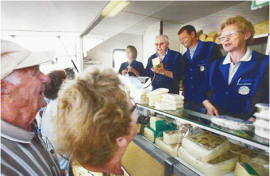
Og her er familien samlet i vognen på vores sidste dag på torvet