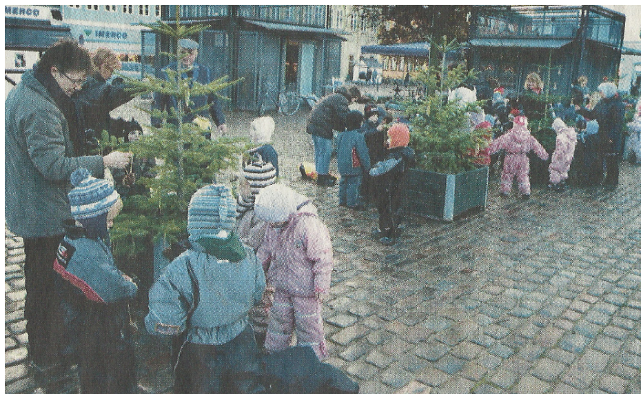
Et dejligt billede af børnehavebørnene i færd med at pynte juletræerne

De første to år stod træerne julen ud, men da pynten året efter blev stjålet, og træerne revet op af kummerne, stoppede vi, for det var synd for børnene.